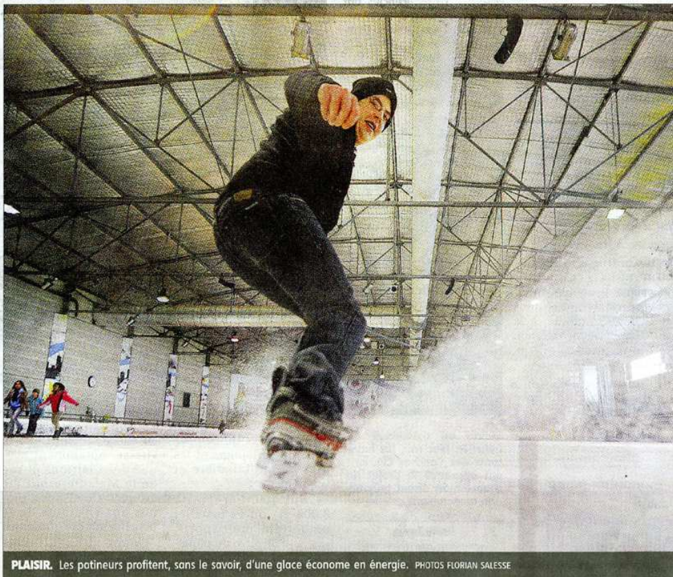
PLAISIR. Les patineurs profitent, sans le savoir, d'une glace économe en énergie.

70 km de micro-tuyaux dissimulés sous la glace